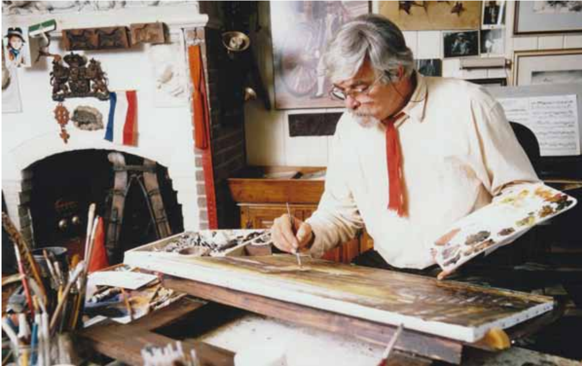
Rien in zijn atelier

Langdurige observatie in de natuur gingen aan zijn tekenen en schilderen vooraf en in zijn atelier zette hij met een haast fotografisch realisme de voorstellingen op papier.